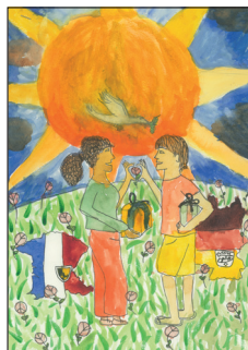
Constantine PINEAU DUIVON CM2 (2 e prix)