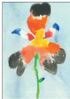
Flora DE PEYER CE2 (3 e prix)