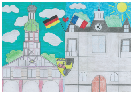
Romane CARRIER CM1 - Gagnante du concours