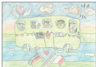
Quentin ESNAULT CE1 (4 e prix)