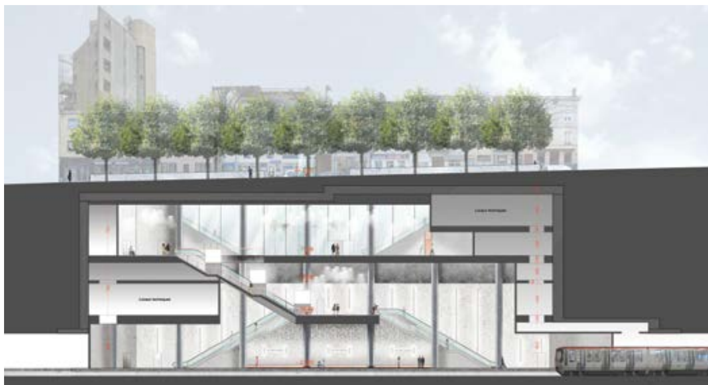
Esquisse de la station de métro Oullins Centre

• La Maison de la presse 3 passage de la Ville a été reprise par Jacques Yviquel 04 78 86 05 12