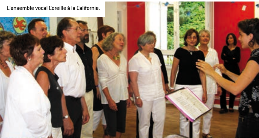
L'ensemble vocal Coreille à la Californie.