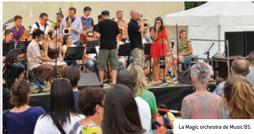
La Magic orchestra de Music'85.