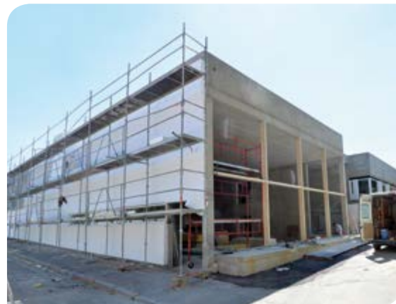
Les nouveaux locaux de l'école Jules-Ferry en travaux.