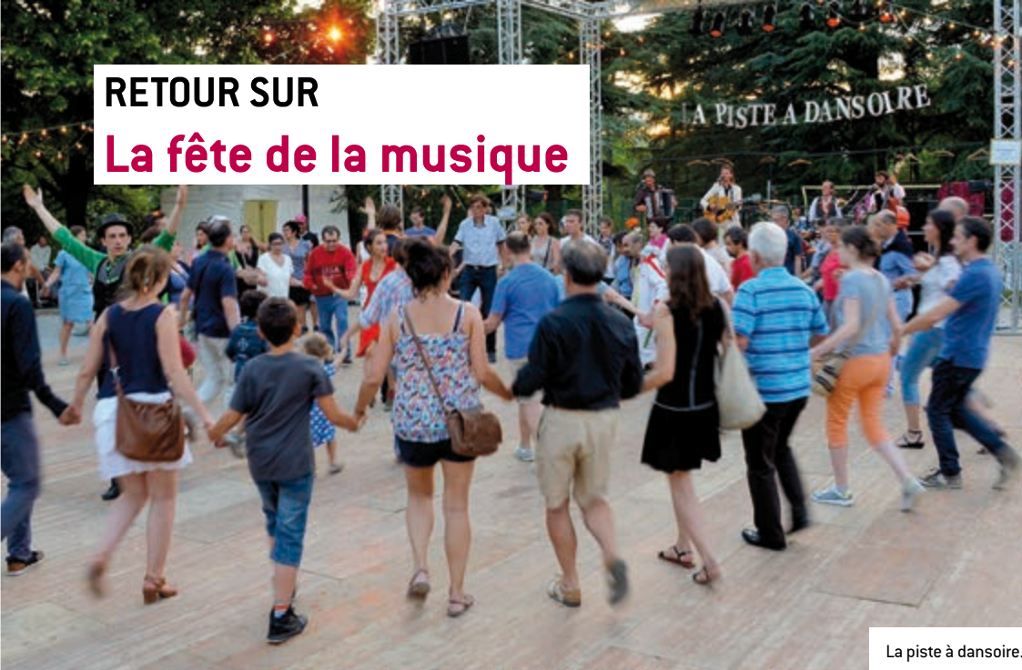
La piste à dansoire.