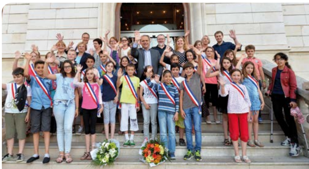
Le CME 2014/2015 réuni une dernière fois lors de l'assemblée plénière du 19 juin.

contente d'avoir pu participer à la vie d'Oullins, lors des commémorations par exemple, et à des projets solidaires comme celui que nous avons mené avec Docteur clown."