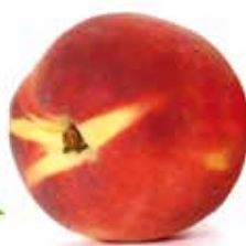
Pêche de l'épicerie