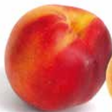
Nectarine de l'épicerie