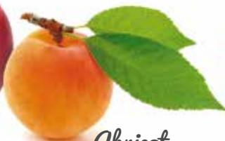
Abricot de Dominique Virieux, producteur Saint-Didier-sous-Riverie