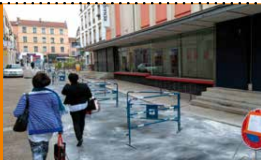
Les travaux ont duré une dizaine de jours

Attention, en raison de travaux au cimetière, son accès sera exceptionnellement fermé du 10 au 20 juin, de 8h à 10h.