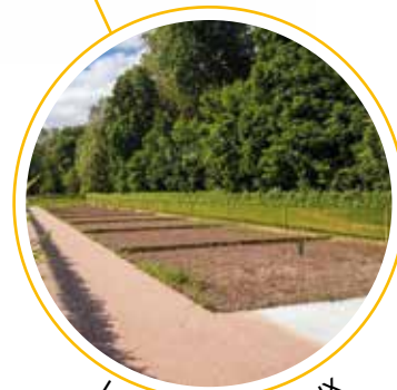
les jardins familiaux