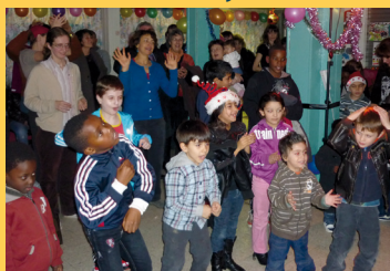
Fête du foyer Bleu Nuit et Adoma