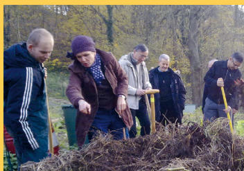
Atelier éco-responsable aux jardins du Golf