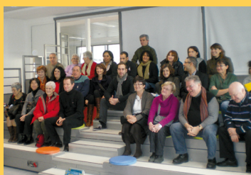
Accueil des Bruxellois