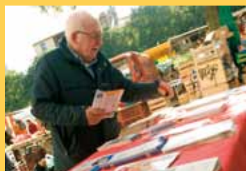
Bus Info Santé