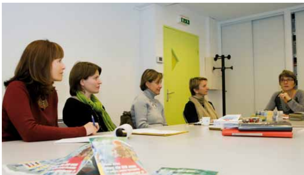
Groupe de travail Atelier Santé Ville