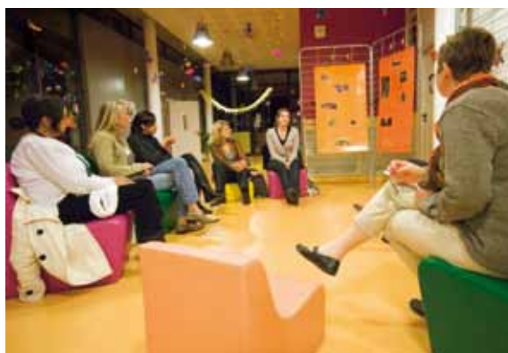
Soirée parents enfants

motivée pour cette soirée car je souhaitais rencontrer d'autres parents ayant des enfants du même âge que le mien. On a échangé en petit comité ce qui nous a permis de faire le point sur des problèmes et solutions à apporter.