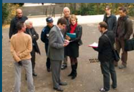
Quartier du Golf - 5 novembre

Les visites cadre de vie sont organisées par le service Politique de la Ville avec le délégué du Préfet, des élus, des techniciens et des habitants.