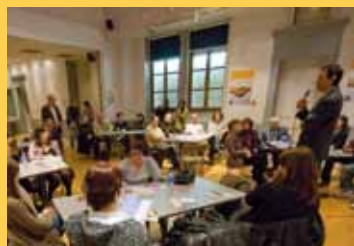
Café des réussites